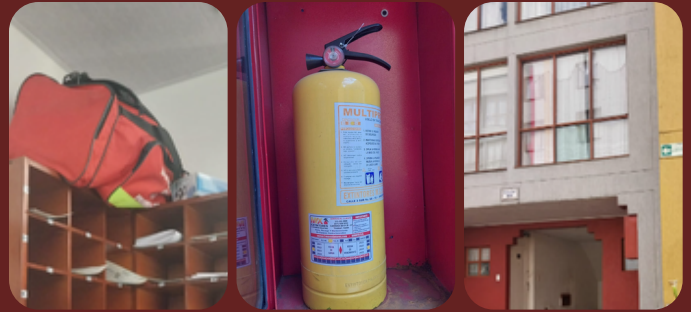
Revisión de estado de extintores