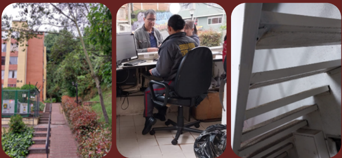
Riesgos en recepción